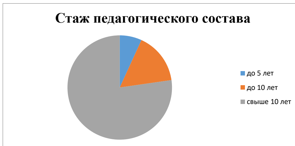
Диаграмма с характеристиками кадрового состава детского сада

С 01.09.2023 детский сад применяет профстандарт педагога-дефектолога, утвержденный приказом Минтруда от 13.03.2023 № 136н . Педагоги постоянно повышают свой профессиональный уровень, эффективно участвуют в работе методических объединений, знакомятся с опытом работы своих коллег и других дошкольных учреждений, а также саморазвиваются. Все это в комплексе дает хороший результат в организации педагогической деятельности и улучшении качества образования и воспитания дошкольников.